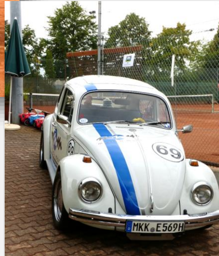
Ihr Unternehmen auf der Clubanlage