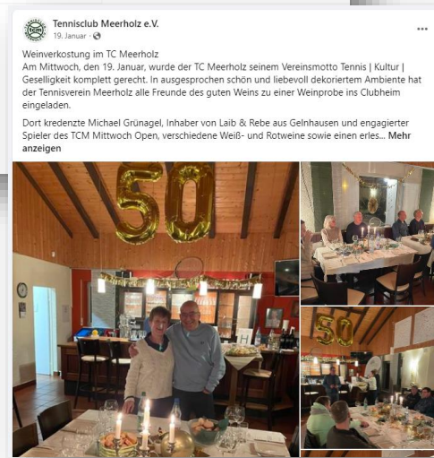
Soziale Medien wie Facebook oder Instagram