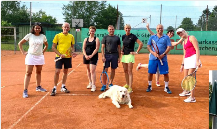
Schnupperkurse für jung und alt